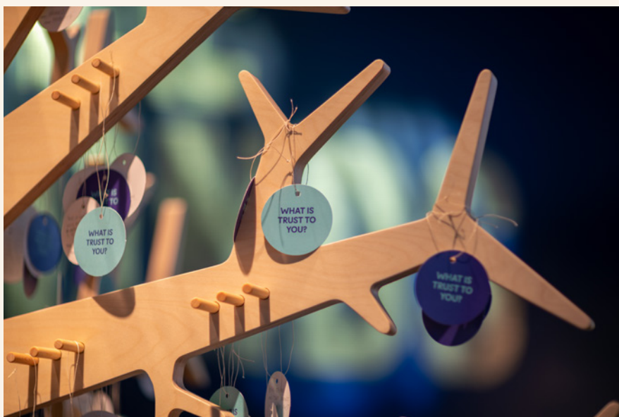
Tree of trust fra ONS-standen 2022.