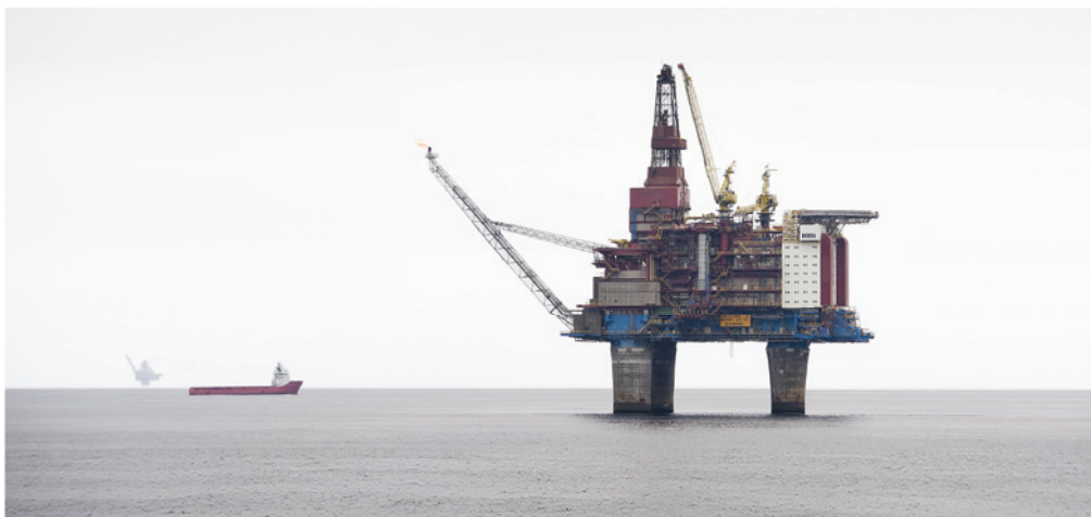
Gullfaks B