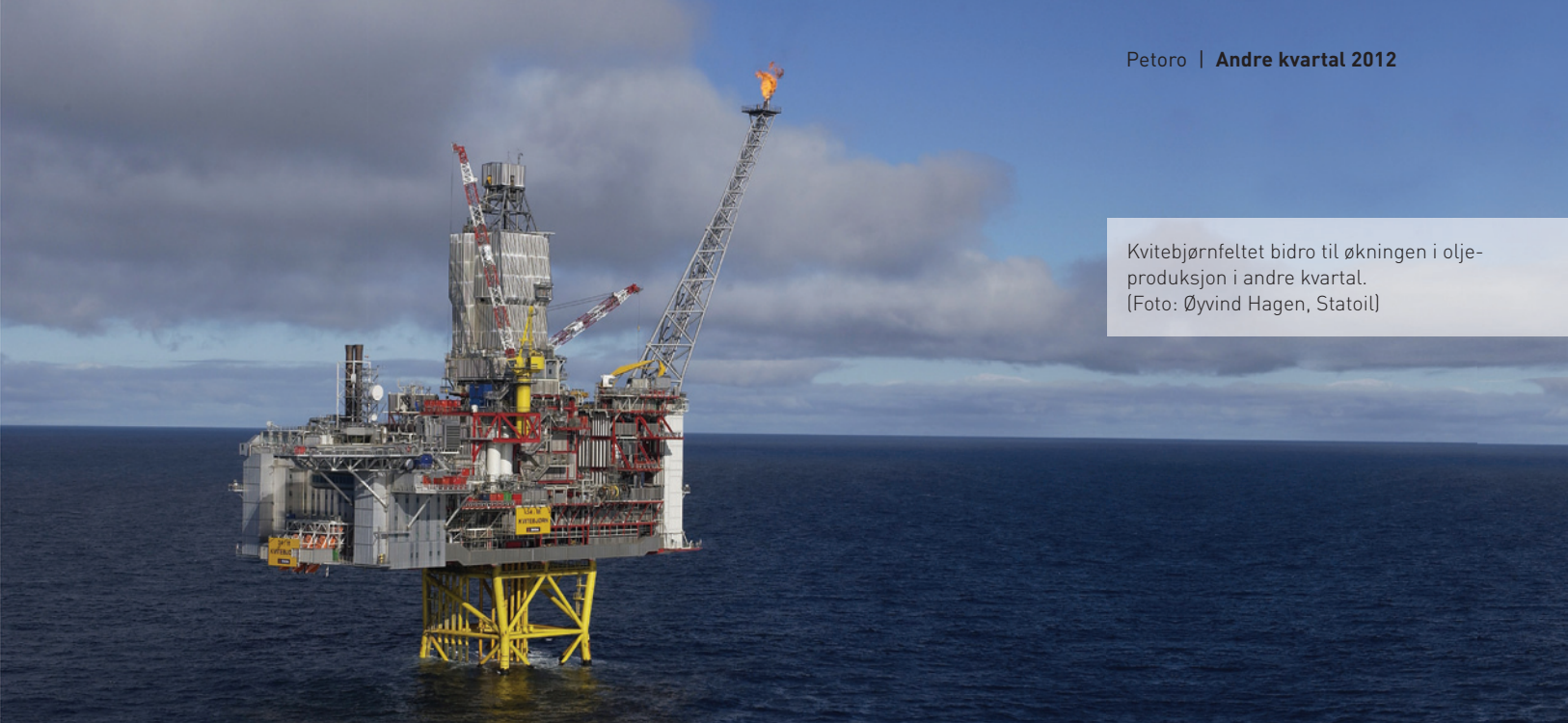
Kvitebjørnfeltet bidro til økningen i olje-produksjon i andre kvartal.

lignet med samme periode i fjor. Oljeprisen i norske kroner var i samme periode syv prosent høyere enn i 2011 - 672 kroner per fat mot 626 kroner i fjor. Årsaken til den høye oljeprisen er strammere markedsbalanse og geopolitiske uroligheter. Oljesalget har hittil i år holdt seg på samme nivå som i 2011.