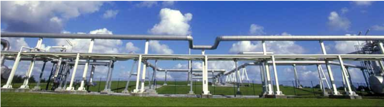
Europeiske gasskjøpere har tatt ut mer gass under de langsiktige kontraktene - det har bidratt til 25 prosent høyere gassproduksjon i 2. kvartal 2010 enn for samme periode året før. Her fra mottaksterminalen for Europipe-røret i Dornum.

Inntekter fra gassalg hittil i år var 27 prosent lavere enn for samme periode i 2009 hovedsakelig grunnet lavere priser. Per første halvår 2010 utgjorde disse gassinntektene 32,3 milliarder kroner mot 44,2 milliarder for samme periode i fjor. Salgsvolumet av egenprodusert gass var per første halvår 19,3 milliarder Sm 3 eller 671 kboed mot 575 kboed i 2009, en økning på 17 prosent. Mot slutten av halvåret viste gassprisene en økning, noe som sammen med produksjonsoppgang bærer bud om økte gassinntekter for 2010.