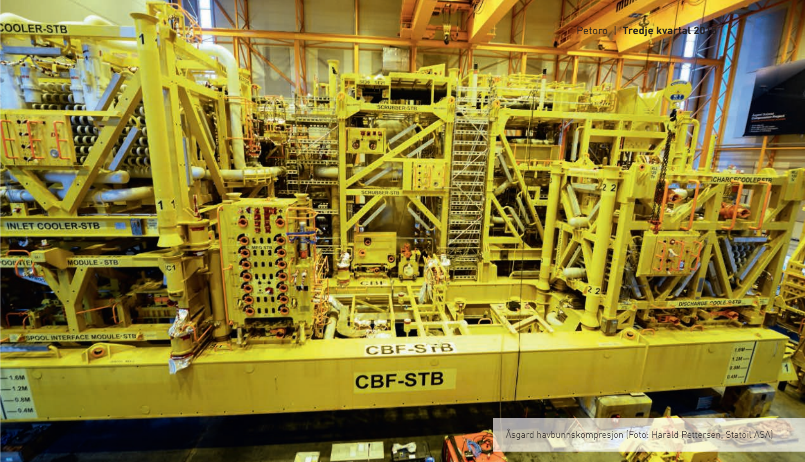
Åsgard havbunnskompresjon

Inntekter fra oljesalg hittil i år var 40 milliarder kroner og 29 prosent lavere enn i 2014. Økning i solgt volum er motvirket av lavere oljepris i norske kroner per fat sammenlignet med tilsvarende periode i 2014.