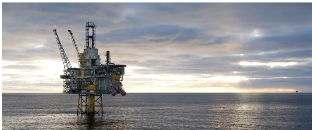
Oseberg Øst

Stavanger, oktober 2012 Styret i Petoro AS