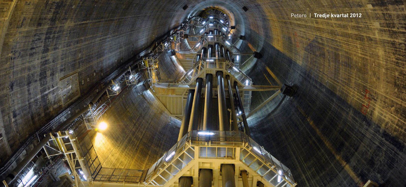
310 meter under havet nede i Troll A skaftet

mot 627 kroner i fjor. Oljesalget har hittil i år vært fire prosent lavere enn i samme periode i 2011.