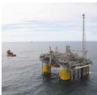
Utslep av Kristin-plattformen.

I andre kvartal kom Snorre og Vigdis tilbake i normal produksjon etter gasslekkasjen i november 2004. Produksjonsanlegget for Snorre for 2005 er redusert med omlag 30 % som følge av at produksjonen var nedstengt i deler av første kvartal på grunn av denne gasslekkasjen. I tillegg påvirkes produksjonen negativt av begrensninger i kapasiteten for gassinjeksjon og av stengte produksjonsbrønner. Det forventes at dette også vil få negativ effekt for produksjonen i 2006.