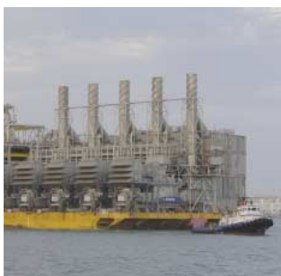
Prosessanlegget til Snøhvit klar- gjøres for transport fra Spania.

Rettighetshavere i Oseberg-området besluttet i slutten av juni å sende inn plan for utbygging og drift (PUD) for funnet Oseberg Delta. Oseberg Delta vil bli bygget ut med en undervannsinstallasjon knyttet til Oseberg feltcenter. Produksjonsstart forventes 1. oktober 2007. SDØEs andel av reservene utgjør ca. 20 millioner fat oljeekvivalenter, andelen av investeringene utgjør ca. 600 millioner kroner. I tillegg kom J-strukturen på Oseberg sør i produksjon i juni, noe senere enn opprinnelig planlagt. Forsinkelsen skyldtes riggstreiken høsten 2004.