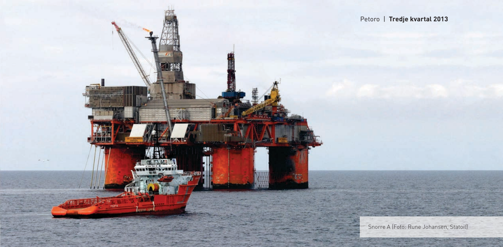
Snorre A

Inntekter fra gassalg hittil i år var 15 prosent lavere enn i samme periode i 2012 som følge av lavere pris og volum. Per tredje kvartal 2013 utgjorde de totale gassinntektene 66,4 milliarder kroner mot 74,1 milliarder for samme periode året før. Salgsvolumet av egenprodusert gass var per tredje kvartal 26,5 milliarder kubikkmeter (Sm 3 ) eller 611 kboed mot 664 kboed i 2012. Gjennomsnittlig gasspris har vært sju øre lavere enn fjoråret.