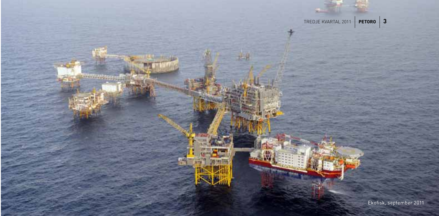
Ekofisk, september 2011

Petoro deltar med 30 prosent i det betydelige oljefunnet i Aldous Major South i Nordsjøen. Sammen med Avaldsnesfunnet viser anslag at dette kan være tredje største oljefunn på norsk sokkel, etter Statfjord og Ekofisk.